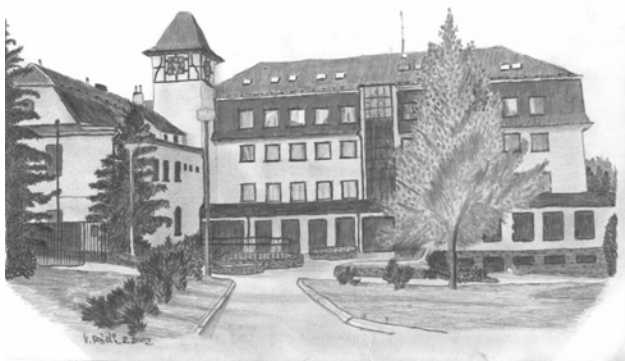
RS Zámeček v Hodoníně u Kunštátu – oblíbené místo rekondičních pobytů AMD ČR. Kresba: Vlastimil Rédl