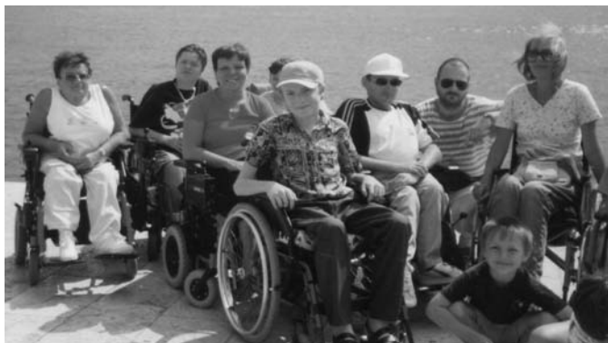
Účastníci ozdravného pobytu v Chorvatsku