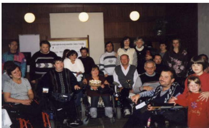
Účastníci I. ročníku memoriálu J. Kasla a V. Krejčího v šachu