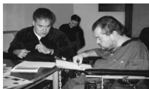
Fotografie z práce kroužku arteterapie