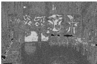
Z výstavy kroužku arteterapie