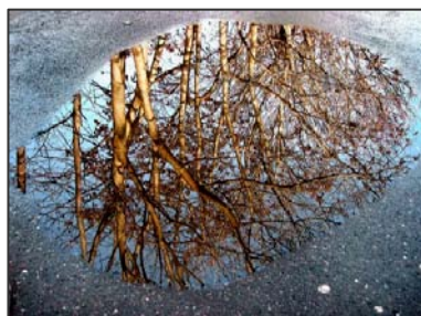
Ukázka z vítězného cyklu „Louže“ Františka Újezdského