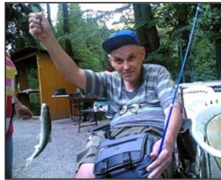
Zámek Velké Losiny a rybaření v losinském rybníčku