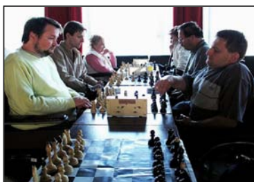
Několik pohledů na hráče soustředěné nad šachovnicemi