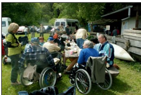
Z Dolan – ukázka šermu a večerní posezení