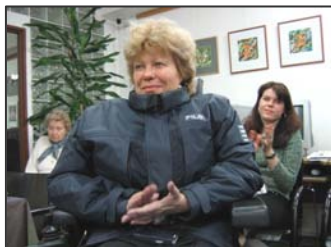
Z vernisáže výstavy kroužku arteterapie v PC klubu Zelený pták