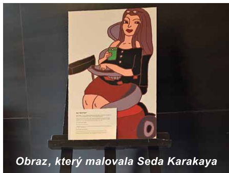
Obraz, který malovala Seda Karakaya