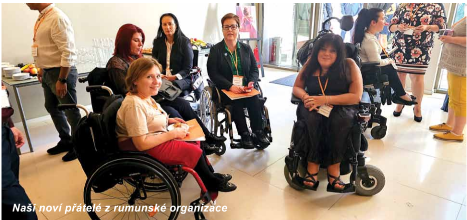
Naši noví přátelé z rumunské organizace