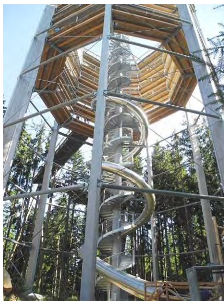
Článek a foto: Veronika Nesměráková

Vzdušnou čarou jako od rozhledny Stezky k Marině Lipno. Tolik bylo celkem použito barevných LED pásků k osvětlení noční Stezky.